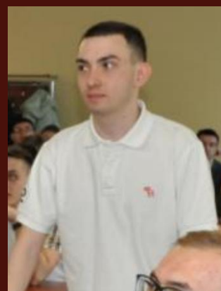
Томаев И. ВСНТК-2021

Подробнее с материалами научных конференций и докладов студентов АКФ разных лет можно ознакомиться в архивах официального сайта АКФ (в разделе «Наука»).