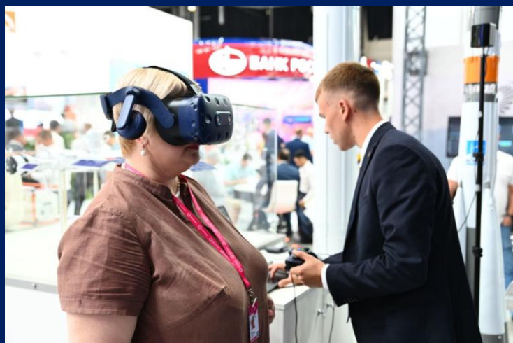
На фото: демонстрация работы VR-симулятора